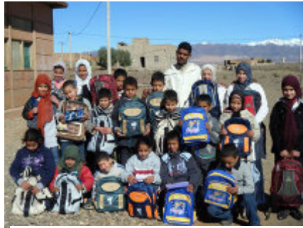
Remise de cartables avec fournitures

tions la nécessité de mieux s'organiser et de prendre leurs responsabilités dans toutes les décisions. L'enjeu principal est la revitalisation de tout le tissu économique de l'artisanat, des petits commerces locaux et bien sûr de l'agriculture. Mais également la préservation du patrimoine culturel et naturel fondée sur le développement durable. En le valorisant, ils pourraient bénéficier économiquement du tourisme.