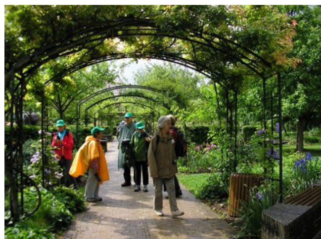
Vendredi 11 Mai 2012 sur la promenade bleue de Rueil-Malmaison au parc du chemin de l'île de Nanterre, avec Seine Vivante

Tranquillement, nous avons traversé le parc urbain du Vésinet, sans rencontrer beaucoup d'oiseaux (quelques males les femelles étaient au nid)