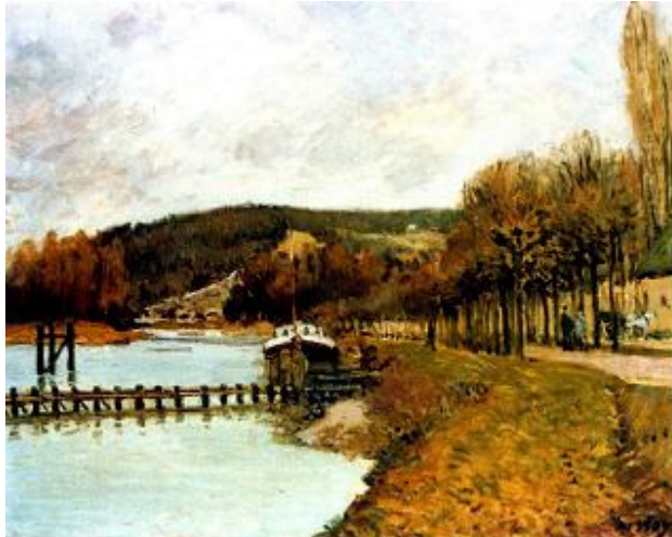
SISLEY - (1875) - Les Coteaux de Bougival - Musée d'Ottawa

Dans un communiqué transmis au Cadeb, l'association Patrimoine et Urbanisme lance un appel à la vigilance pour la préservation d'espaces de nature sur les coteaux de Seine.