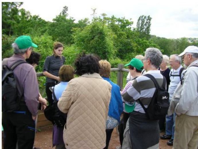
Mercredi 9 Mai : promenade sur la « future voie verte » Paris Londres depuis la gare du RER A de Chatou-Croissy, avec Seine Vivante

Bravant le temps pluvieux, 10 courageux participants, équipés contre la pluie, se sont retrouvés, à la gare de RER de Rueil à l'heure (malgré les incidents techniques !)