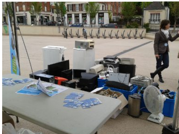
En tout, 627 kg ont été collectés sur la place du marché.

Compte tenu de la réussite de l'expérimentation, la commune du Vésinet souhaite reconduire régulièrement la collecte éphémère des DEEE.