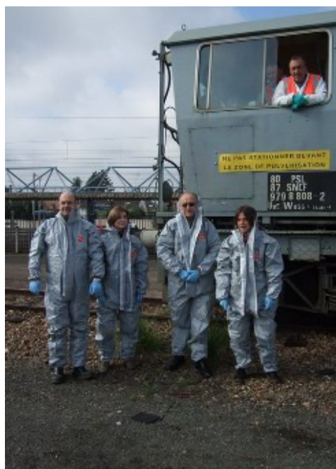
Les membres des associations revêtus de leurs combinaisons

L'Infra pôle SNCF Paris Saint Lazare entretient environ 800 km de voies de Paris Saint Lazare à Gisors, Vernon, Evreux, Versailles, .... Pour ce faire, il possède des trains et quads désherbeurs. Le train désherbeur est constitué d'un wagon spécialisé avec réserves d'eau et produit, mélangeurs, rampes d'application, pupitre de commande. Il est tracté par un locotracteur. Il n'est pas pratiqué de mélange manuel des produits avec l'eau. La projection du produit ne se fait qu'à faible vitesse (20-30 km/h) soit à l'avant sur une surface couvrant la voie en projection basse, ou plus largement à droite ou à gauche par rampe de projection haute. Un système infrarouge est installé sur ce train et permet de n'arroser que les zones avec végétation (économie de produit = moindre