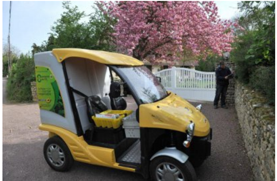
Un quad électrique est en service à Sartrouville.

Depuis janvier 2012, La Poste déploie VALORA Papiers, une activité de collecte des papiers de bureau à recycler auprès de l'ensemble des petites et moyennes entreprises et collectivités locales d'Île-de-France. Venu pour collec-