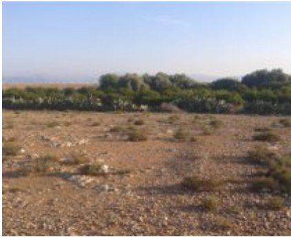
Vue sur le terrain destiné au projet

Dans la province de Chichaoua, dans le sud marocain, à l'ouest de Marrakech, un terrain de 1000 m 2 est prêt. Afoulki se donne quatre ans pour y réaliser une maison du développement de 300 m 2 destinée à rayonner sur toute la région. Elle fait appel à toutes les bonnes volontés.